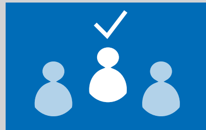
Sorgfältig ausgesuchte Mitarbeiter