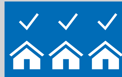
Fortlaufende Qualitäts- kontrollen im «Feld»