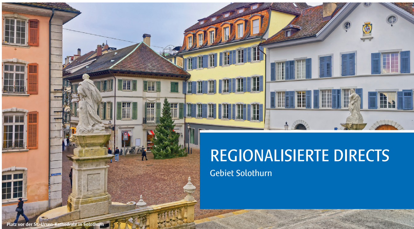
Platz vor der St.-Ursen-Kathedrale in Solothurn