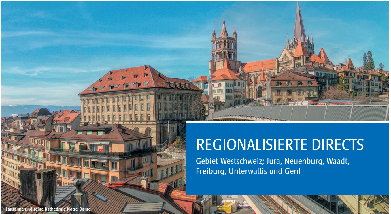
Lausanne und seine Kathedrale Notre-Dame